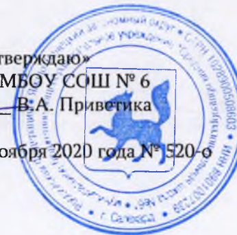
График питания учащихся 1-5 классов на 2 четверть 2020-2021 учебного года 1 СМЕНА